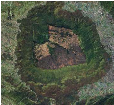
ภาพถ่ายดาวเทียม อุทยานแห่งชาติภูกระดึง อำเภอภูกระดึง จังหวัดเลย