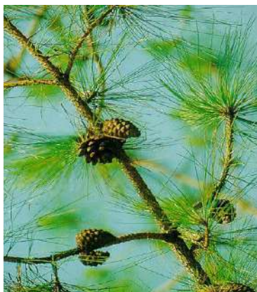
ชื่อ พรรณไม้ สนสามใบ ชื่อ วิทยาศาสตร์ Pinus Kesiya

เป็นต้นไม้ที่พระบาทสมเด็จพระเจ้าอยู่หัวและสมเด็จพระนางเจ้าพระบรมราชินีนาถทรงปลูกตามคำกราบบังคมทูลของนายเทียม คมกฤช อธิบดีกรมป่าไม้ เพื่อเป็นสิริมงคลและเป็นอนุสรณ์ในการเสด็จพระราชดำเนินขึ้นยอดภูกระดึง เมื่อเวลาเช้าของวันอาทิตย์ที่ 6 พฤศจิกายน พ.ศ.2498 (จากหนังสือรอยเสด็จมหาวิทยาลัยขอนแก่น 2540)และสมเด็จพระนางเจ้าพระบรมราชินีนาถ ได้พระราชทานกล้าไม้มงคลให้กับผู้ว่าราชการจังหวัดเลย ในงานวันรณรงค์โครงการปลูกป่าถาวรเฉลิมพระเกียรติพระบาทสมเด็จพระเจ้าอยู่หัว ในโอกาสที่ครองราชย์ปีที่ 50 เมื่อวันที่ 9 พฤษภาคม 2537 ณ ศูนย์ประชุมแห่งชาติสิริกิติ์ ให้เป็นต้นไม้ประจำจังหวัดเลย